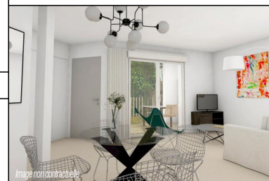
Image non contractuelle

Plan de commercialisation Document non contractuel