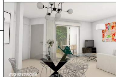
Image non contractuelle

Plan de commercialisation Document non contractuel